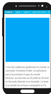
Pavé Mobile (Web & App)