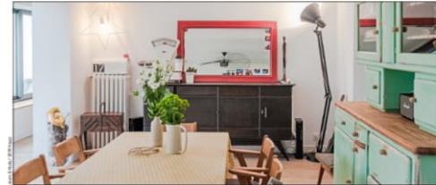
C'est la plus simple, bien connue des décorateurs, est de commander du mobilier de design et d'époque différents.