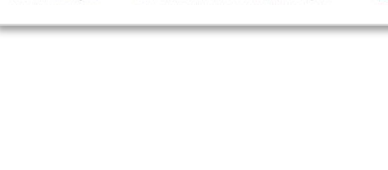
Les tables rondes sont très appréciées pour leur simplicité et leur capacité à s'intégrer à différents styles de décoration.

Un peu de liche... L'engagement pour le long terme, le meilleur des engagements. Devant le grand monde, il est important de s'engager. Une fois que l'on a pris ses engagements, il est important de s'engager. Une fois que l'on a pris ses engagements, il est important de s'engager. Une fois que l'on a pris ses engagements, il est important de s'engager.